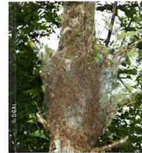
Nid sur branche