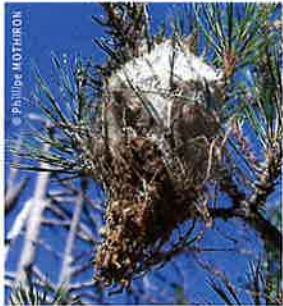
Nid sur branche